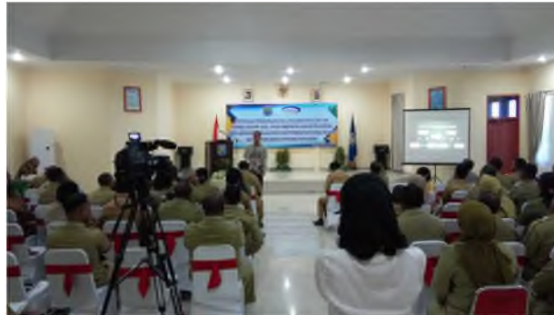
Gambar 3.2 Penyerahan Piagam SPIP se-Papua Barat Oleh BPKP- Perwakilan tahun 2019.

berkala. Pelaksanaan reviu , audit kinerja maupun pemeriksaan dengan tujuan tertentu hingga evaluasi dan monitoring kegiatan OPD yang dilaksanakan untuk meningkatkan pengawasan internal guna pengendalian kebijakan Kepala Daerah agar tetap sejalan dan berkesinambungan terhadap visi dan misi Bupati Sorong dan mempertahankan Opini BPK-RI terhadap laporan keuangan Pemda.