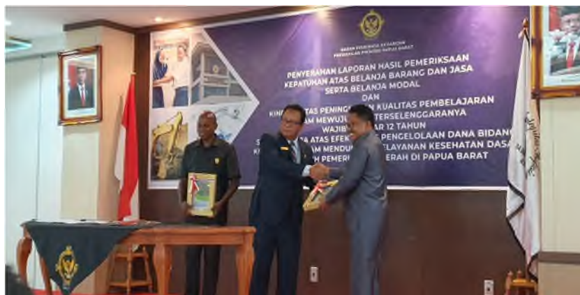
Gambar 3.4 Laporan tindak lanjut APIP Kab.Sorong pada BPKP-Perwakilan.

Dari indikator diatas Penurunan temuan material BPK yang telah ditindak lanjuti tahun 2021 adalah 85.11%. Penurunan jumlah temuan dan temuan material yang telah ditindaklanjuti oleh APIP meningkat dan menempati urutan pertama se-Papua Barat dan merupakan kerjasama yang baik pada seluruh OPD dilingkungan kabupaten sorong.