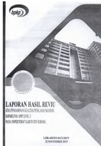
Gambar 3.1 Laporan Hasil Reviu Penilaian Kapabilitas APIP.